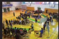
スカットボール大会