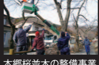
本郷桜並木の整備事業