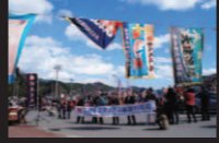
三陸鉄道全線運転再開