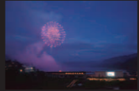
ゆめあかり × LIGHT UP NIPPON