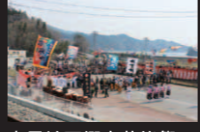
唐丹地区郷土芸能祭