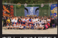
唐丹小・中学校合同運動会